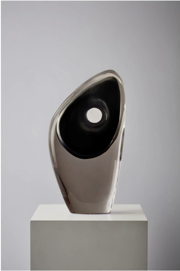
ABOVE 《Zone Collection》 Kelly Hoppen / SV CASA