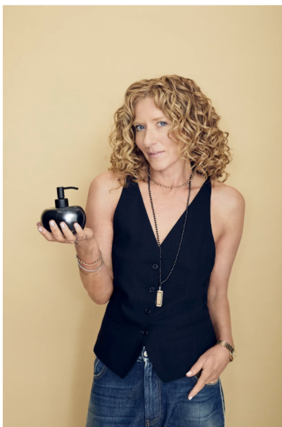
ABOVE Kelly Hoppen與奢侈品零售商 SV CASA聯手推出第一個衛浴家居系列作品。

延伸閱讀： 打造美觀且實用的家並不難？屢屢獲獎的設計師Kelly Hoppen分享她的獨門秘訣