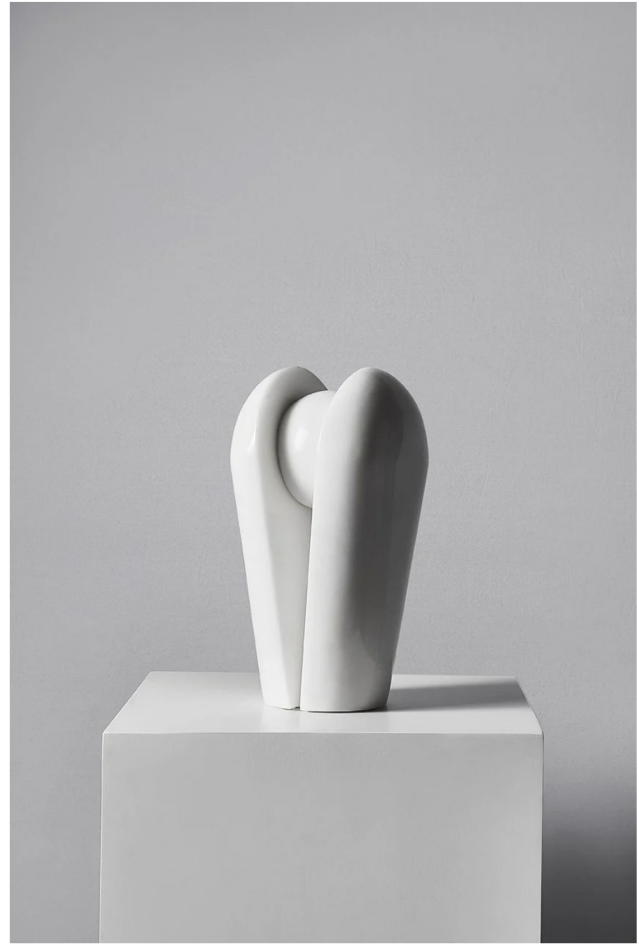
ABOVE 《Orb Collection》 Kelly Hoppen / SV CASA