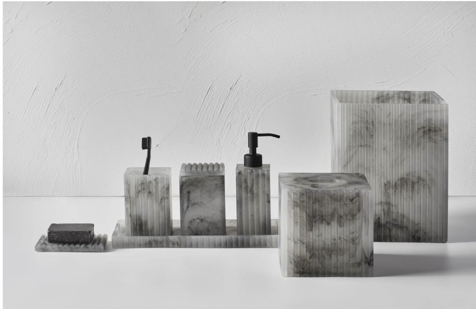
《Ripple Collection》 Kelly Hoppen / SF CASA

《波紋之藏》（Ripple Collection）如同水面上波紋帶來寧靜安適，Kelly Hoppen在浴室泛起陣陣視覺波紋，以穿戴水墨衣裳的配件玩出設計新意。《卵石之美》（Pebble Collection）則象徵卵石是一種完美的生物，它雖然不會讓人想起任何氣味、不帶慾望與侵略性，但其熾熱與冷酷都充滿尊貴氣質，在Kelly Hoppen手中化作極致的墨黑藝術。